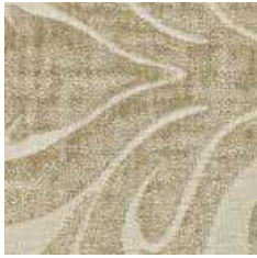
LBAG 2 - cat. A