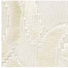
E 601 - cat. A