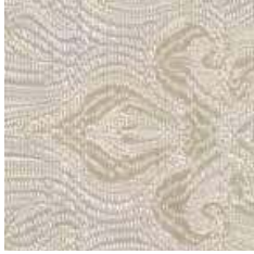
MCE 11 - cat. A