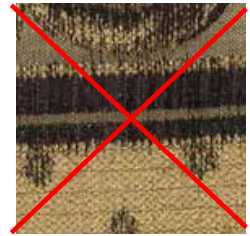
E 301 - cat. B