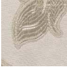
MCE 16 - cat. A