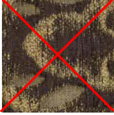
E 401 - cat. B