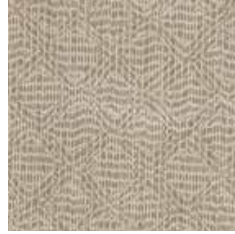
MSI 916 - cat. A