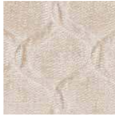
G 096 - cat. B