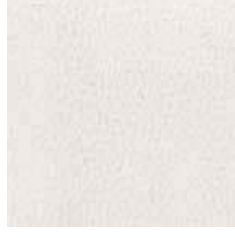
Pelle P 03 - cat. B