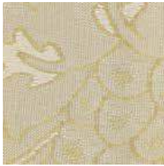
S 391 - cat. B