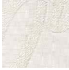
LBAF 1 - cat. A