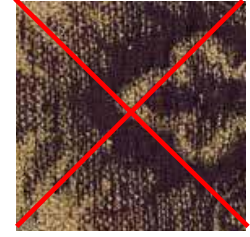
E 193 - cat. B