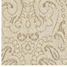
MTR 21 - cat. A