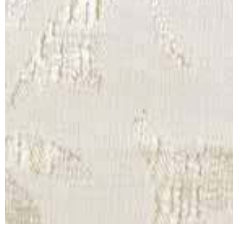
E 9261 - cat. A