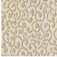
MTR 20 - cat. A