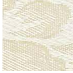
E 901 - cat. A