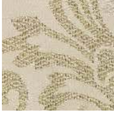
MDE 2 - cat. A