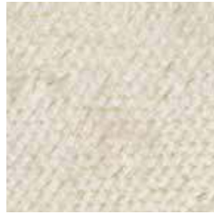
M 0012 - cat. A