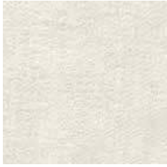
LBAU 1 - cat. A