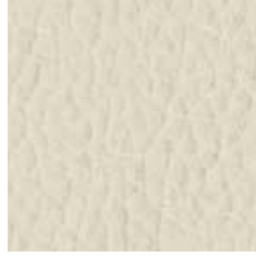
Pelle P 01 - cat. B