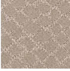
AC 070 - cat. A