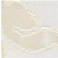
E 4601 - cat. A