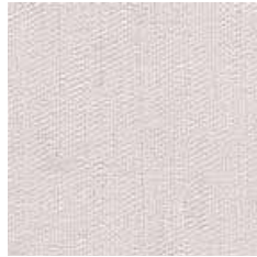
G 0921 - cat. B