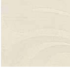
AC 7101 - cat. A