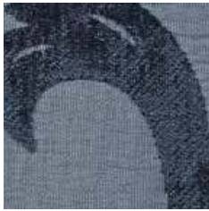
LBAF 7 - cat. A