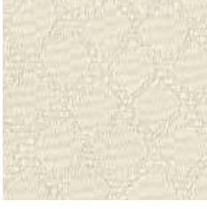
AC 7001 - cat. A