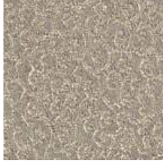
MTR 33 - cat. A