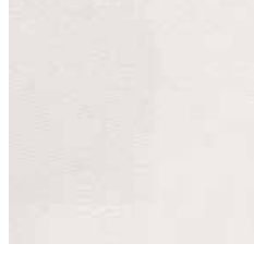
AC 6611 - cat. A