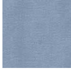
AC 6643 - cat. A