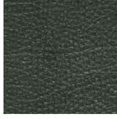
Pelle P 04 - cat. B