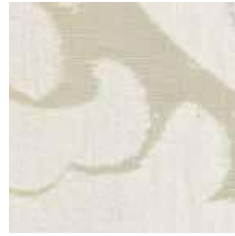
V 912 - cat. B