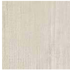
DS 5329 - cat. B