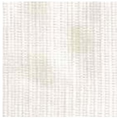
E 501 - cat. A