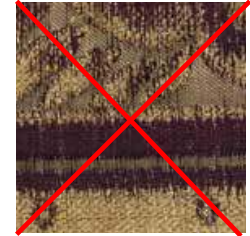
E 194 - cat. B