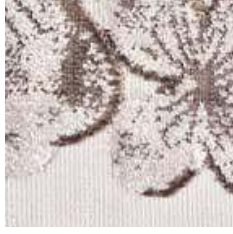
E 9311 - cat. A