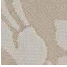
AC 7128 - cat. A