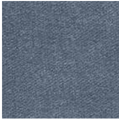
LBAU 7 - cat. A