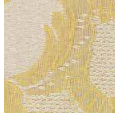
M 41 - cat. A