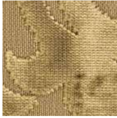
E 603 - cat. A