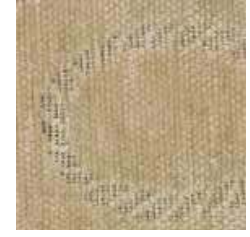
E 074 - cat. A