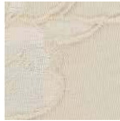
CT 02 - cat. B