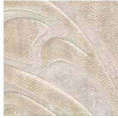
G 097 - cat. B