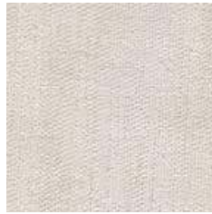
G 092 - cat. B