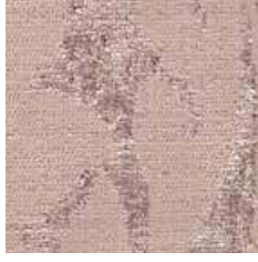
F 926.06 - cat. A