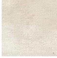
E 9342 - cat. A