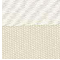
E 337 - cat. A