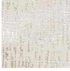
E 9281 - cat. A