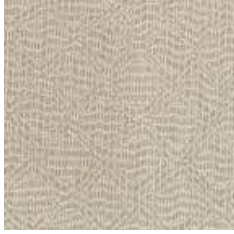
MSI 911 - cat. A