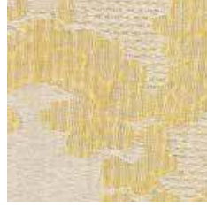
M 10 - cat. A