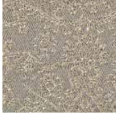
MTR 23 - cat. A