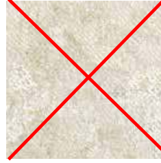
V 902 - cat. A