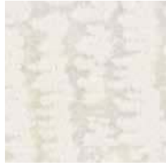
E 1341 - cat. A